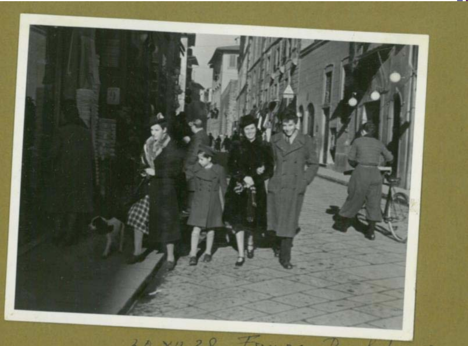
20 X 12 28 Firenze D. 1