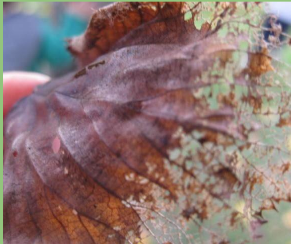
Foglia di tiglio in autunno avanzato