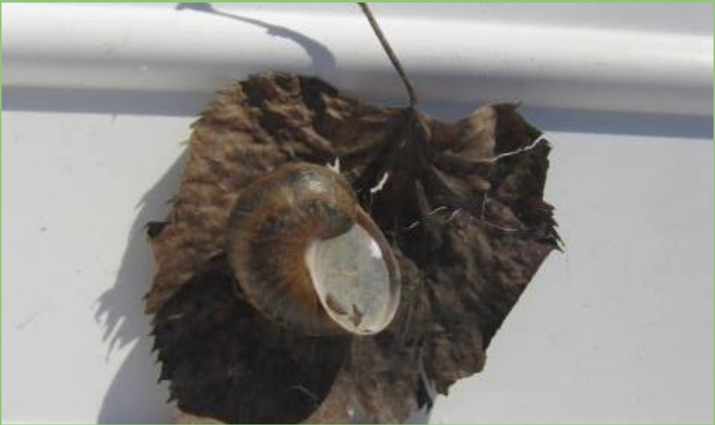
Cornu sp. (Helix sp.) Chiocciola o Lumachina