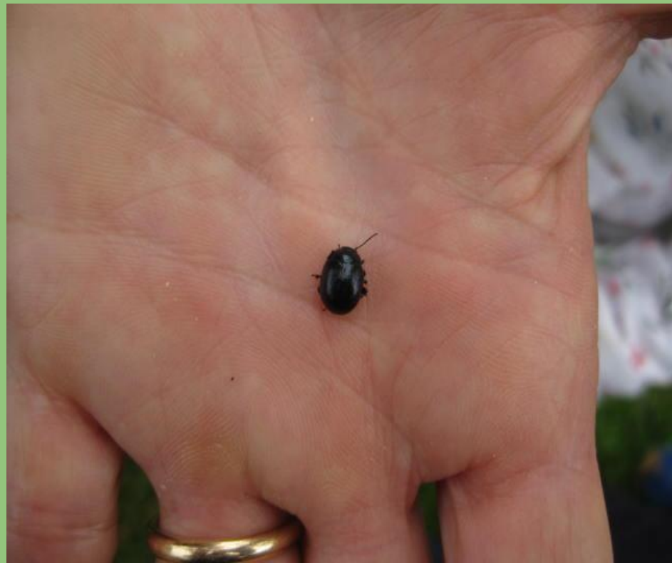
Coleottero crisomelide Coleottero