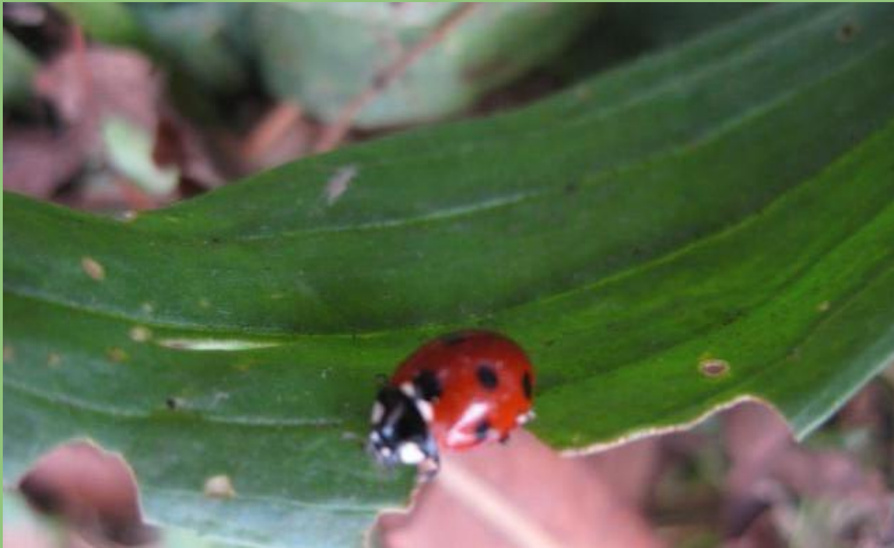
Coccinella septempunctata Coccinella