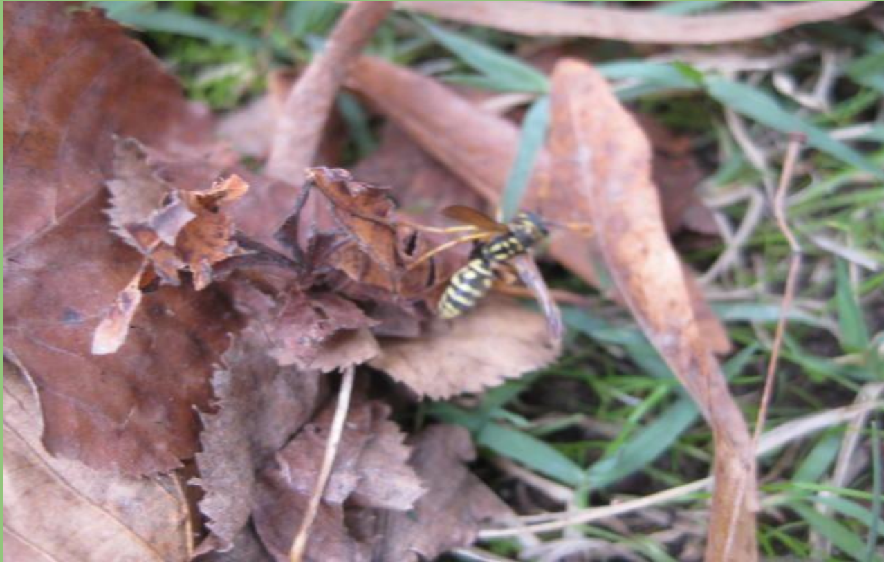
Vespa vulgaris Vespa